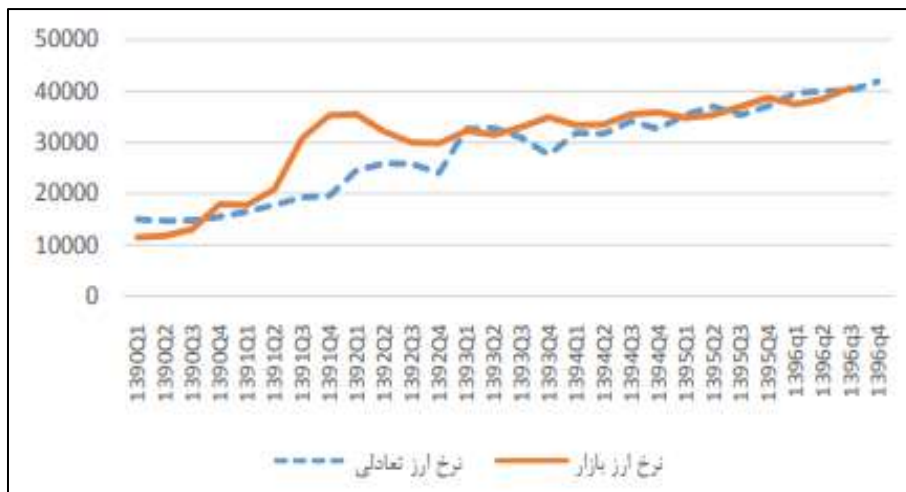
نمودار ۲. تغییرات نرخ ارز در طول سال‌های مختلف

سیاست‌های مالی و ارزی کشور، می‌تواند بخش قابل توجهی از نوسانات موجود در بازار ارز را با تدابیر پیشگیرانه و اتخاذ سیاست‌های مناسب به حداقل رسانده تا در آینده، اقتصاد کشور دچار شوک‌های شدید ناشی از اتخاذ تدابیر سطحی و زودگذر نشود. توزیع مناسب و به‌اندازه ارز به بازار، توجه به صنایع و مایحتاج عمومی مردم، در اولویت قرار گرفتن اخذ ارز موردنیاز، تعیین نرخ مرجع مناسب با توجه به شرایط بازار و... می‌تواند بخشی از تدابیر دوراندیشانه دولت در کنترل قیمت و بازار ارز محسوب شود. از این رو لازم است، بخش‌های تاثیرگذار بر بازار، با اعتماد به نظرات کارشناسان دلسوز اقتصادی، زمینه را برای تحقق اقتصاد مقاومتی به‌عنوان شاه‌کلید عبور کشتی نظام از حوادث پیش‌روی خود، بیش از پیش فراهم نمایند (یوسف‌زاده، ۱۳۹۴: ۴۸).