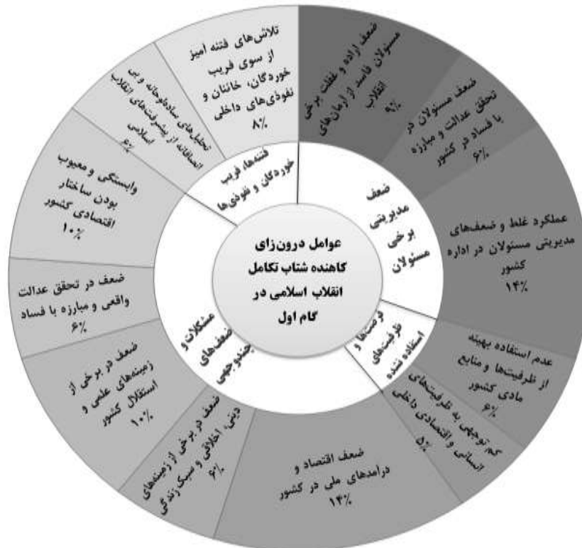
شکل ۲. شمای عوامل درون‌زای کاهنده شتاب تکامل انقلاب اسلامی در گام اول

در بحث تطبیق یافته‌های این مطالعه با تحقیقات پیشین، مؤلفه‌های حاصل از جدول ۵ این پژوهش، با نتایج پژوهش حیدری و حیدری (۱۳۹۹) در مسائل فساد، عدالت، ضعف مدیریت، کم‌کاری‌ها، اقتصاد و سبک زندگی تطابق دارد. از سوی دیگر با یافته‌های مطالعه جمال‌زاده و باباخانی (۱۳۹۶) پیرامون دنیاخواهی و راحت‌طلبی خواص و کم‌کاری آنان، جعفری و دبیری (۱۳۹۹) در حوزه چالش‌های اقتصادی و خطر فساد همخوانی دارد. همچنین با یافته‌های پژوهش محمدی (۱۳۹۹) پیرامون عوامل تضعیف‌کننده پیشرفت انقلاب اسلامی پیرامون ضعف در مدیریت به‌ویژه مدیریت جهادی و ضعف‌های علمی و اخلاقی همخوانی دارد. نتایج یافته‌های غفاری (۱۳۹۷) پیرامون پیشرفت اقتصادی با یافته‌های مطالعه حاضر مبتنی بر مشکلات اقتصادی و ظرفیت‌های استفاده نشده رابطه معکوس دارد. البته نتایج پژوهش حاضر