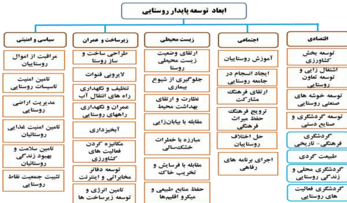
شکل ۱: الگوی جامع توسعه پایدار روستایی